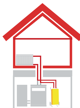
Fonction: Mode de chauffage

Le chariot de transport rend l'appareil très mobile et permet une installation variable. Il est utilisable en très peu de temps sur n'importe quel site et est prêt à fonctionner en quelques heures.